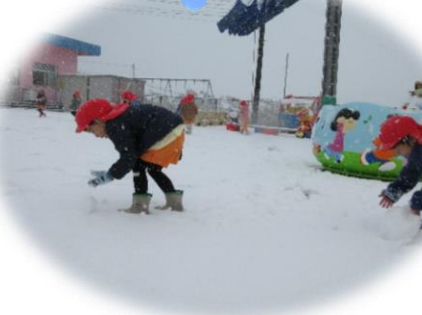
雪だるまつ くるど~