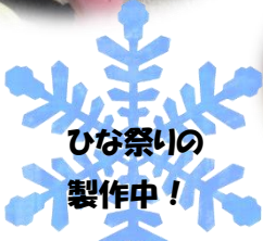
ひな祭りの 製作中!