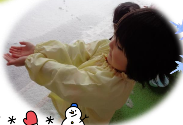
冷たいけど、ス テキだなあ...