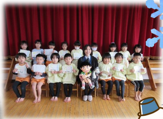
最後の交通 安全教室 で、修了証