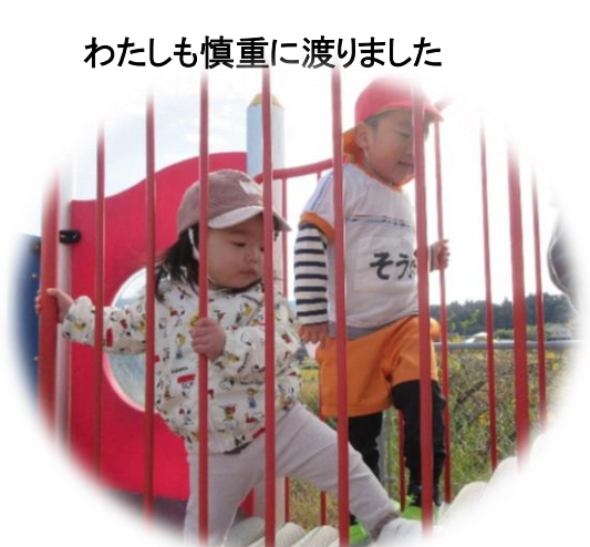
わたしも慎重に渡りました