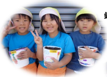
鉢に好きなものを描きました☆