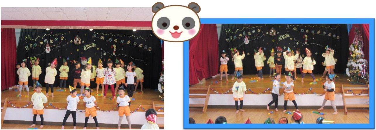
ぱんだ組さんは、♪ピクミンの歌とジングルベルロック♪を披露しました