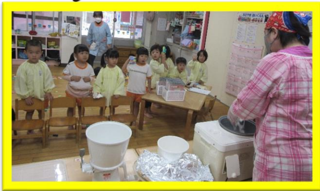
こあら組でもちつき開始