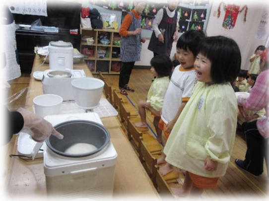
おもちが出来上がっていくのが嬉しいね 餅つきを見学しました