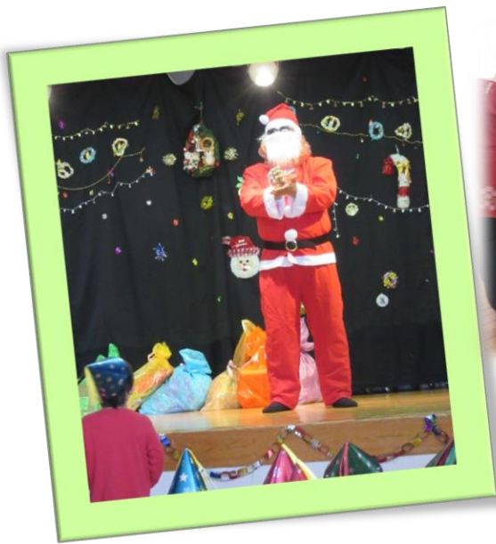
青山保育園にも サンタクロースさん が来てくれましたよ！！