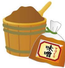
各家庭で味噌汁や豚味噌を作ってもらったようです。