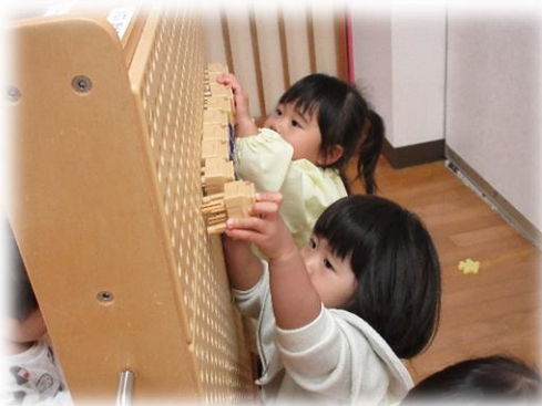
スクルーハンドーツール遊び