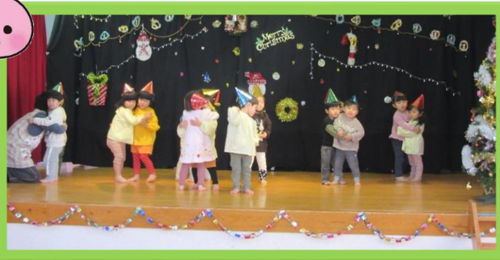
うさぎ組さんは、♪ピカピカブー♪を披露しました