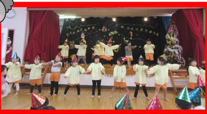
こあら組さんは、♪トリコ♪を披露しました