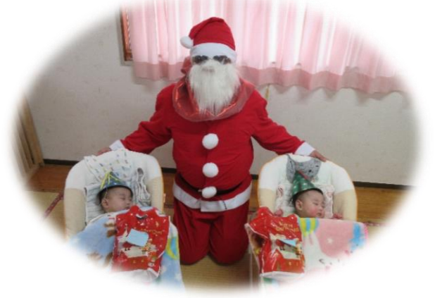
ひよこ組のお友だちにもプレゼントが届きました。