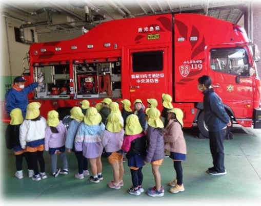
消防車かっこいい！