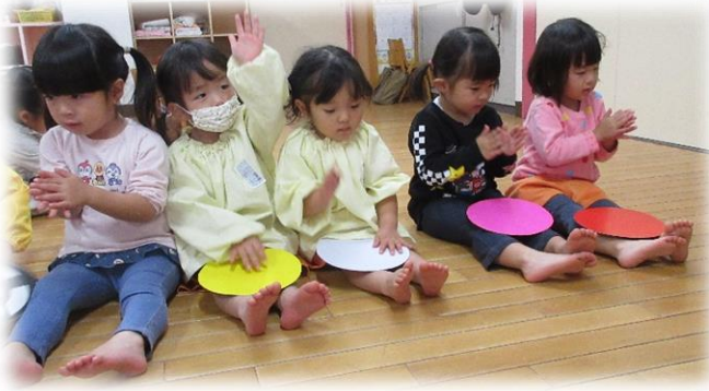
リズム「リズム打ち」