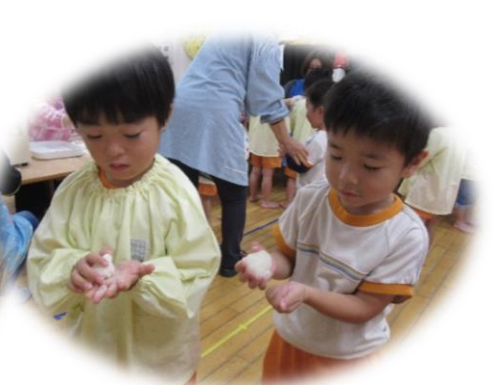
上手に丸められるかなあ～