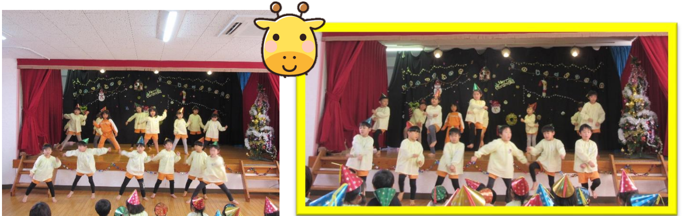
きりん組さんは、♪ダンスホール♪を披露しました