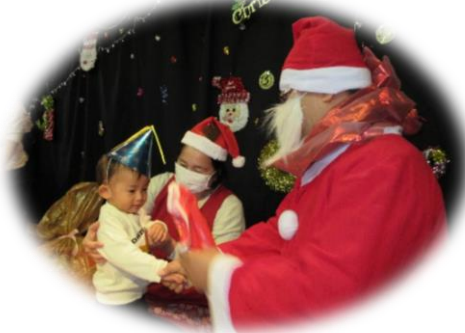
サンタさんの顔って…