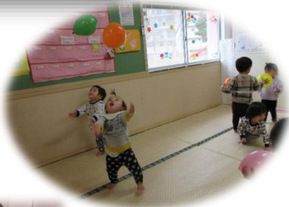
風船遊び そーれーポーン