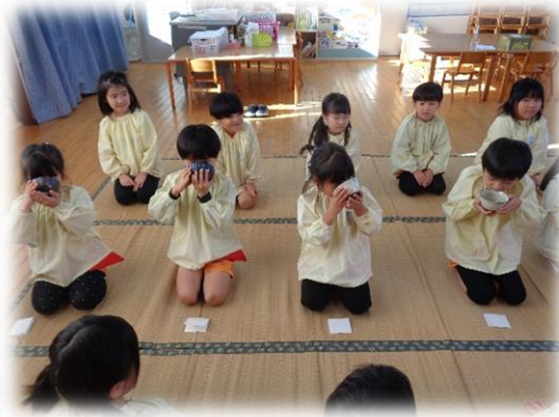
「にが〜い!!」「思ったより飲みやすかった」と感想が分かれました。