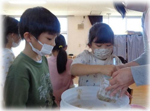
おいしいお味噌ができたかな？