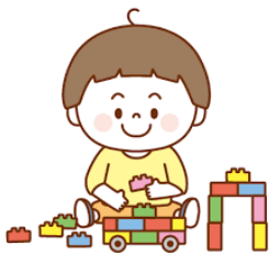
ちよっと力があるぞ～