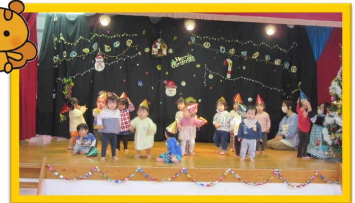
りす組さんは、♪ソフトクリームになあれ♪を披露しました