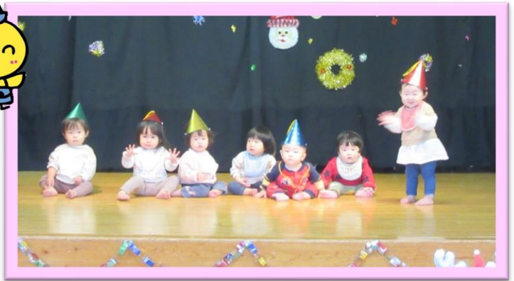
ひよこ組さんは、♪ピカピカブー♪を披露しました