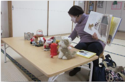
信子先生がお友だちをたくさん連れてきてくれたよ