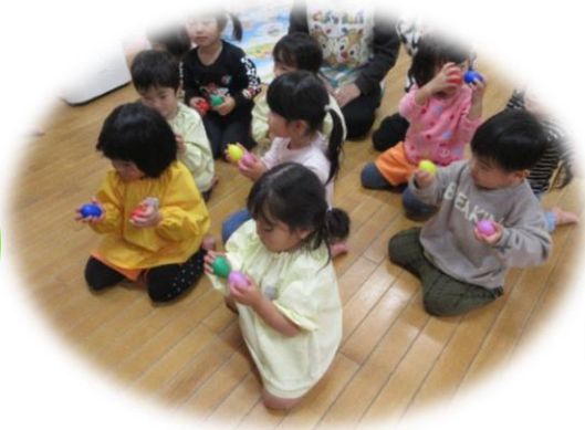
リズム「エッグシェーカー」