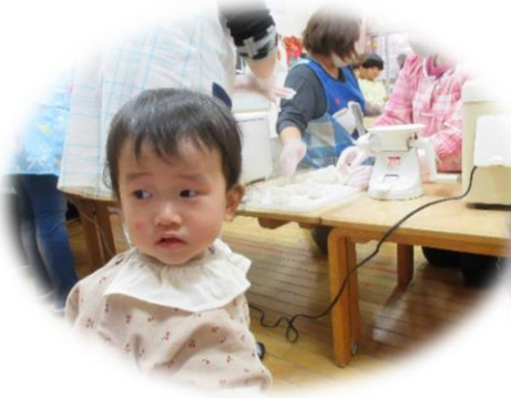
興味深々キョロキョロ