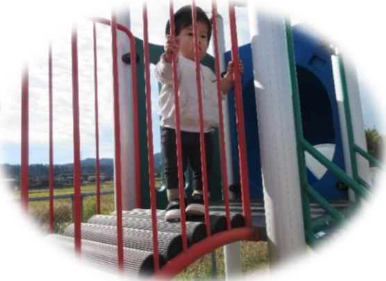
サンシャインキッズの太鼓橋を渡りました