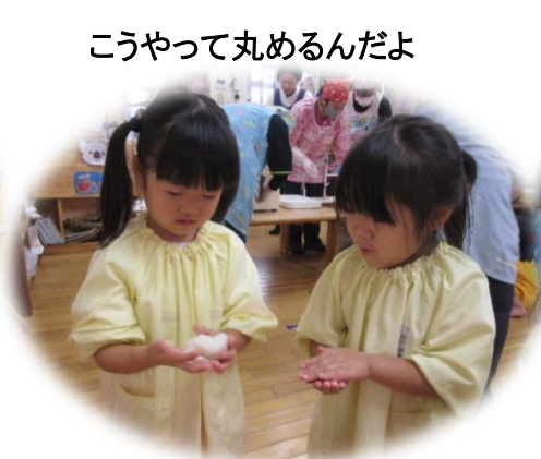
こうやって丸めるんだよ