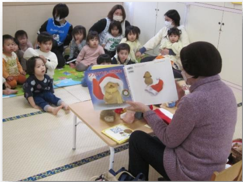
お話ひろば クリスマスのお話でした。