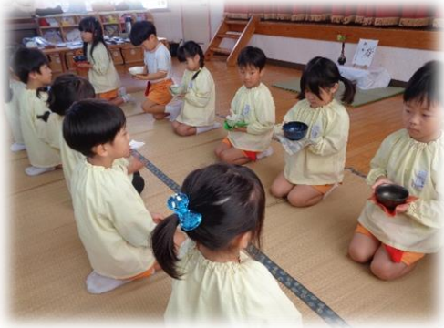
お茶のお稽古で抹茶を飲みました。