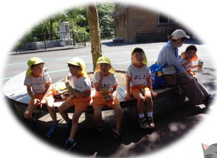
ほっと一息、おやつタイム♪