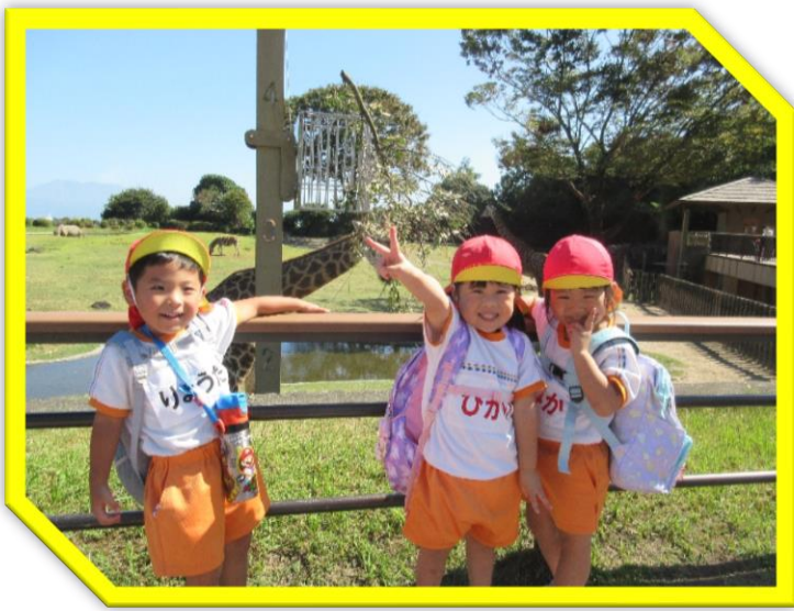
きりんさんと・・・