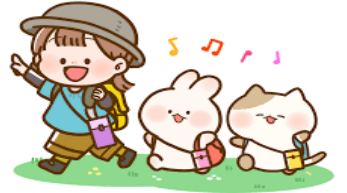
やったー！ぼくはやいでしょ？