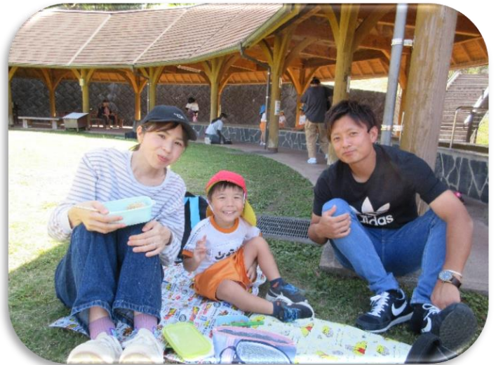
パパとママを一人占め～！お弁当おいしいね。