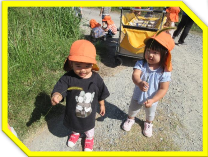
おもしろいのみ～つけた♡