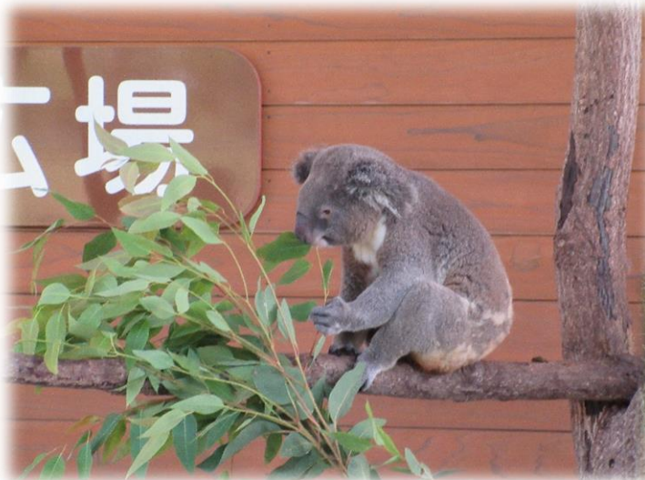
コアラのえさの時間です