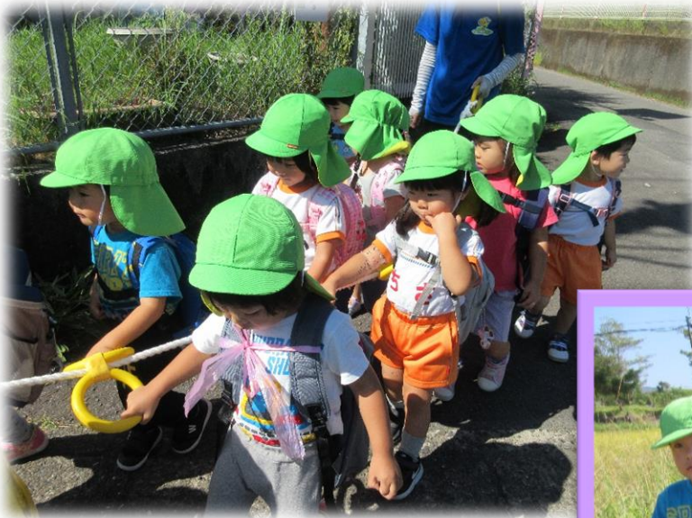
お散歩リングでルンルンお散歩