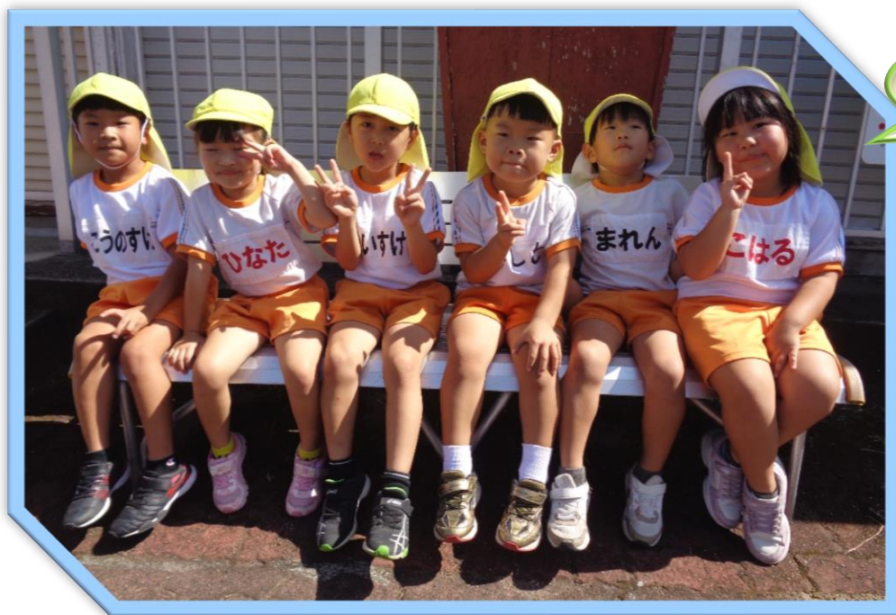
遊園地でのんびり...