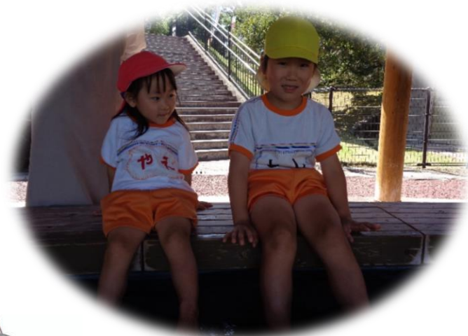
足湯気持ちいいね！