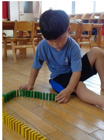
集中してドミノ並べています