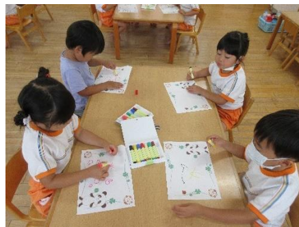
ぱんだ組は、似顔絵を描いてプレゼントしました。