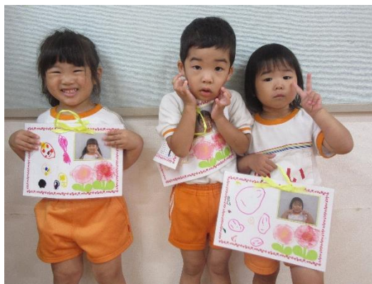
こあら組 「パパママいつもありがとう。」 表はカレンダー、裏は似顔絵を描きました。