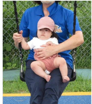
先生と一緒にブランコに乗っています。