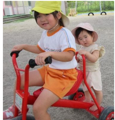
年長児さんから自転車に乗せてもらいました。