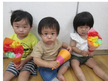
りす組は、花束にして大好きなパパとママにプレゼントしました。