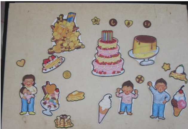
5月の出し物のパネルシアター