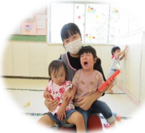
ママ～( ; ∇ ; )

★家では「ママして～」と何でも私に頼ってくる子が、保育園ではすごくしっかり洋服を準備したりお友だちの折り紙を手伝っていてびっくりしました。しっかりできるか心配でしたが、知らない間にお姉ちゃんになっていてとても嬉しかったです。