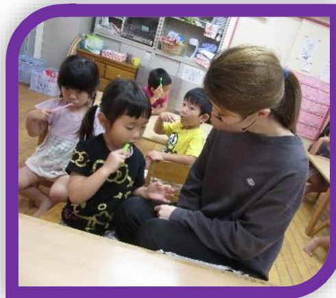
お母さんと一緒に嬉しいな♪