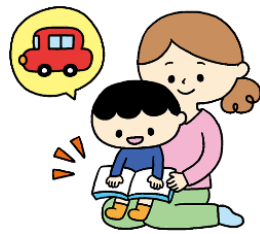
絵本の読み聞かせドキドキする～。